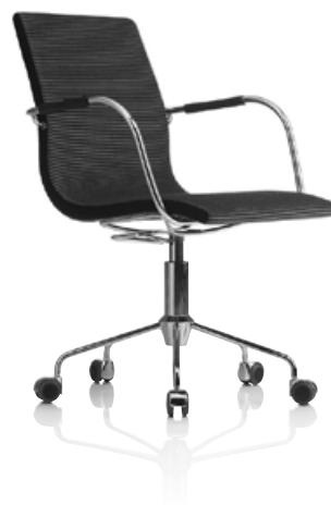
Starbase / Starbase

Designers Johannes Foersom Peter Hiort-Lorenzen