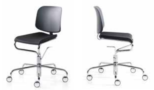
Pall 46/56 / Stool 46/56