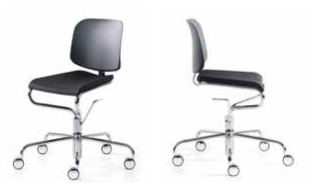
Pall 46/56 / Stool 46/56