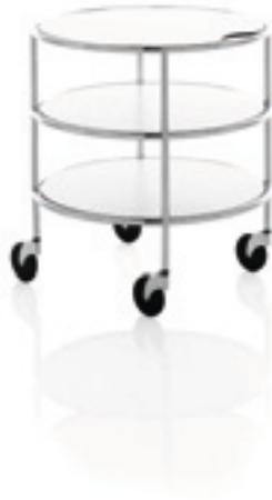
Vagn / Trolley