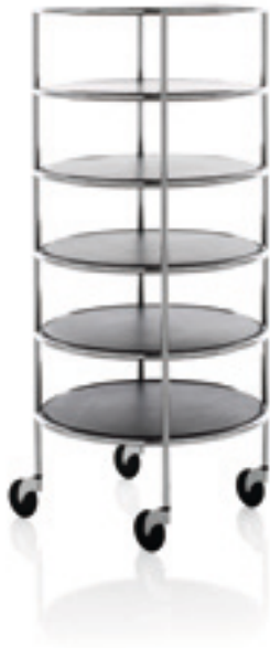
Vagn / Trolley